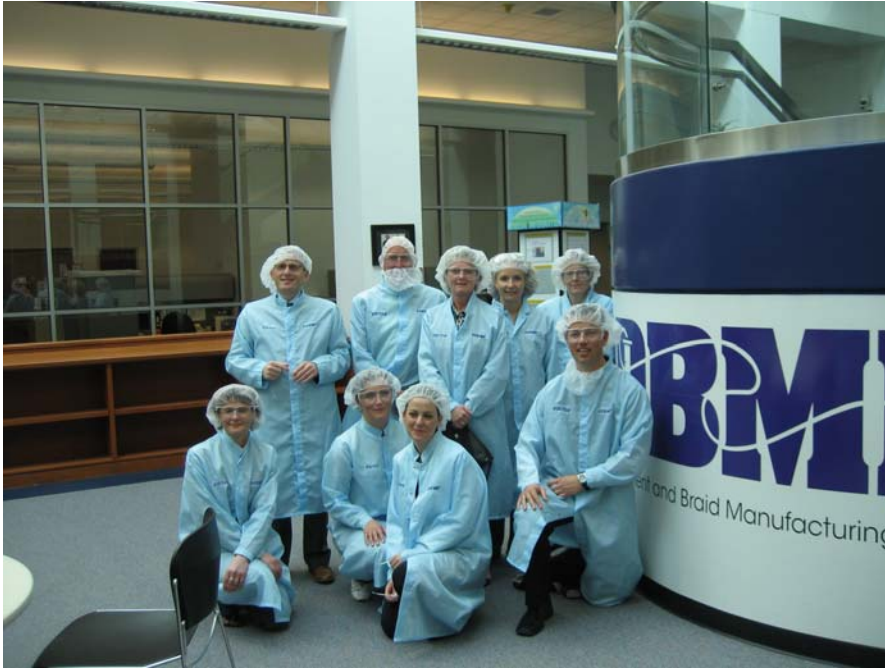
Hela kursskaran samlad och klara för att träda in i Tycos suturtillverkningsfabrik

När vi sedan kom tillbaka till Norwalk fick vi veta förutsättningarna för vår slutliga presentation som vi skulle göra på fredagen och eftermiddagen ägnades åt det. På kvällen åkte vi in till själva centrum av Norwalk och åt middag med ytterligare någon herre med fin titel Supervisor. Det är väldigt mycket titlar i USA. Han var i alla fall expert på området diabetes/obesitas och vi skulle få ta del av hans kunskaper senare i veckan.