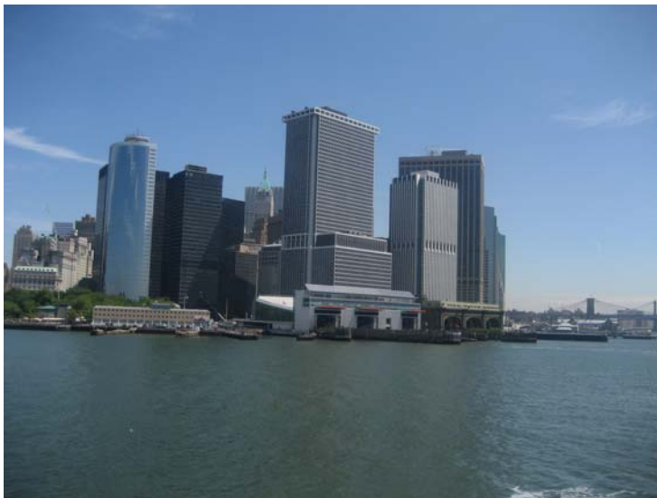
Södra New York, på väg ut till Frihetsgudinnan