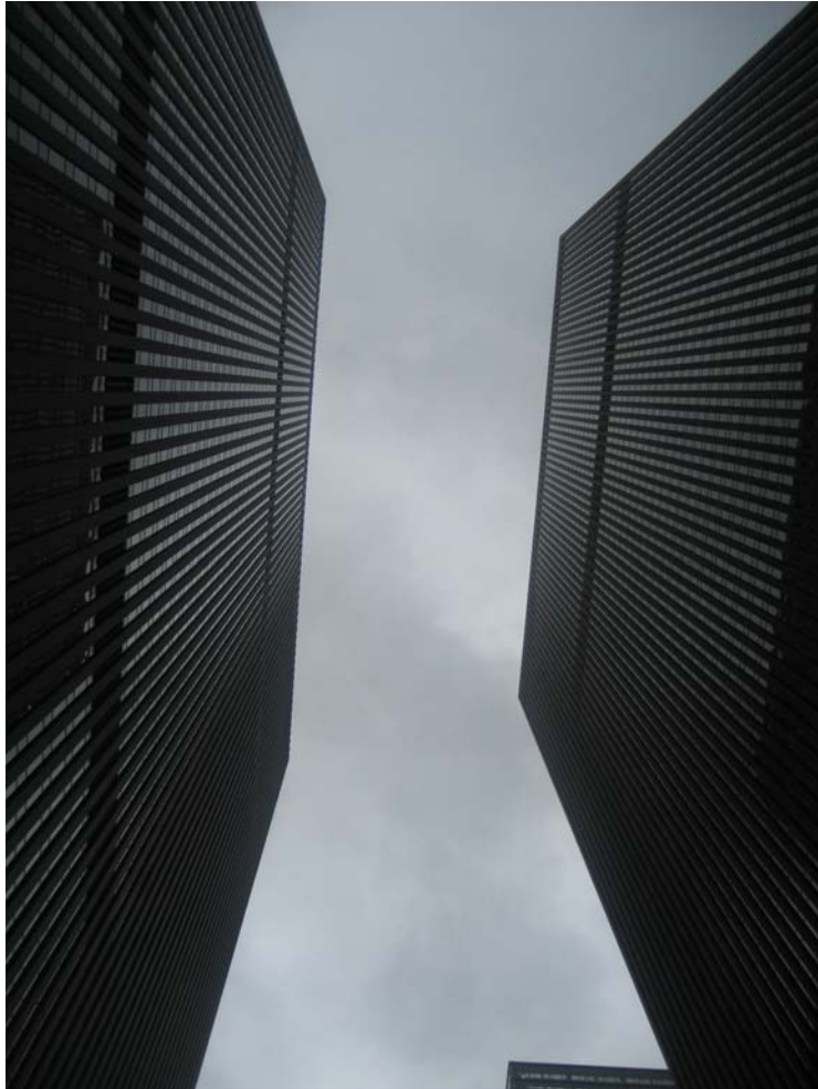
Foto taget rakt upp mot himlen från någon gata i New York

Reseberättelse Lotta Schagerström Opssk Övre gastrosektionen USÖ