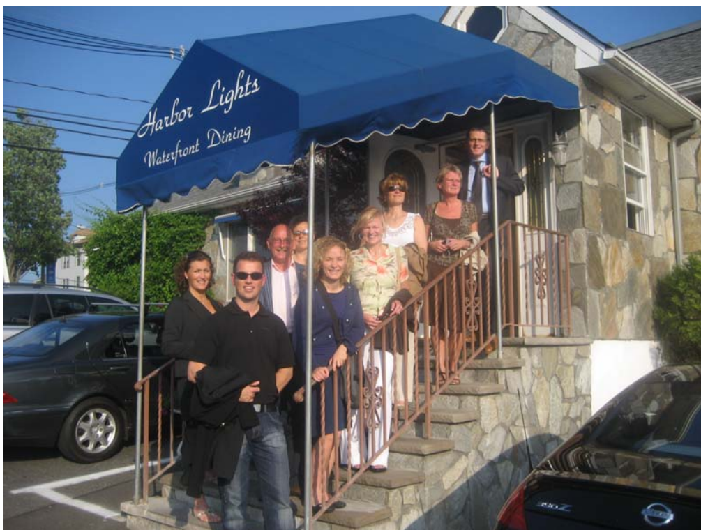
Alla samlade för tisdagens middag

Kliniker kan när de vill göra en ansökan för att bli ett "Centre of Excellence". Efter genomgång av sjukhuset kan det bestämmas om de är godkända eller om de måste komplettera/förändra några delar.