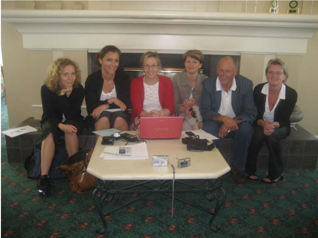
Alla känner vi oss nöjda med slutresultatet av vår presentation.