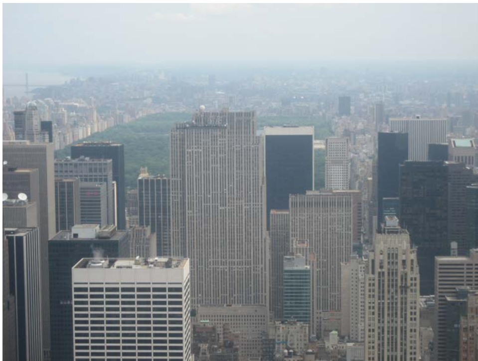
Utsikt över norra Manhattan och Central park från Empire State Building

Sista natten med några av kursdeltagarna bodde vi på ett fint hotell mitt i New York alldeles vid Times Square. Times Square skulle man kunna kalla kärnan av Manhattan. Alla teatrar ligger där och det är precis smockat med affärer, trafik, extremt stora neonskyltar och människor. På kvällen var vi på ”Hard Rock Café” och åt hamburgare av den stora modellen.