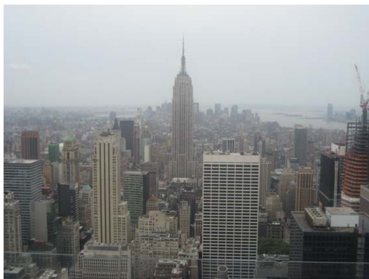
Utsikt från Rockefeller Center